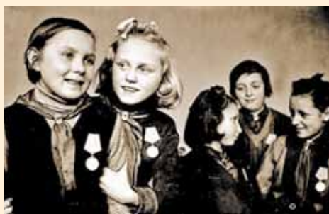
Отличницы 4-го класса 47-й школы г. Ленинграда, награжденные медалями «За оборону Ленинграда». Ноябрь 1943 г.

За самоотверженный труд в тылу тысячи подростков были награждены орденами СССР, медалями «За трудовую доблесть», «За трудовое отличие», «За доблестный труд в Великой Отечественной войне 1941 – 1945 гг.».