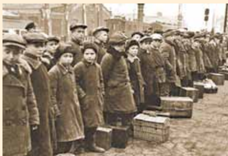
Прибыли работать на завод

Значительный вклад в производство продукции для фронта внесли выпускники ремесленных училищ и школ ФЗО, в которых с июля 1942 по 1945 год различные производственные специальности получили более 2 миллионов юношей и девушек. На один из заводов Свердловска в начале 1942 года пришло более 100 выпускников ремесленных